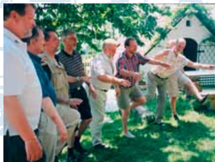
Partasuiden akrobaattiesitys Kis Csutorásin maalais-csárdaan pihalla