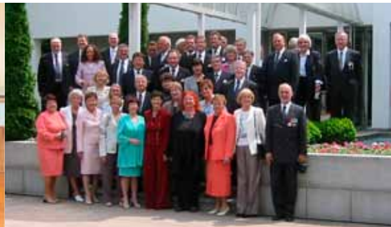
Kuorolaisia rouvineen Unkarin lähetystön portailla kesällä 2004