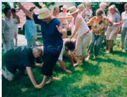
... ja rouvat harrastivat käsien päällä kävelyä