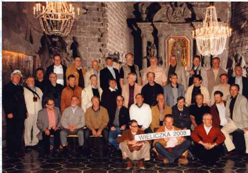
Kuorolaiset yhteiskuvassa Wieliczkan suolakaivoksen juhlatilassa kesällä 2008