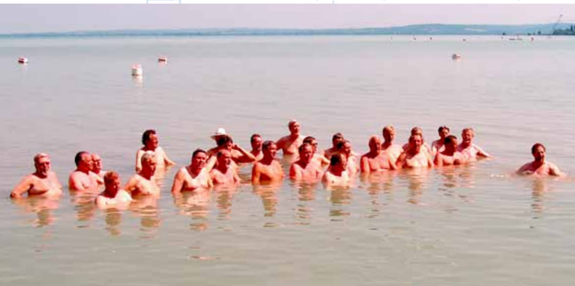
Kuoro polvillaan Balaton-järvessä "Sua lähde kaunis katselen"