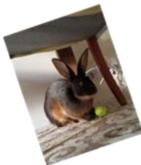
Lapsille karvainen yllätysvieras Matu.